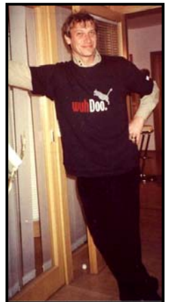
Fotos links, unten: WuhDoos am Ziel – Schlemmen im VIP-Zelt Fotos rechts: Immer wieder erstaunlich, welche Anziehungskraft die schwarzen WuhDoo-Shirts auf Union-Prominenz ausüben...