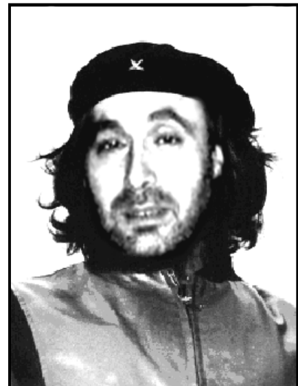
„El Commandante“ Bo'onè: Viva Wuhlistan ! Viva la Rewuhlution